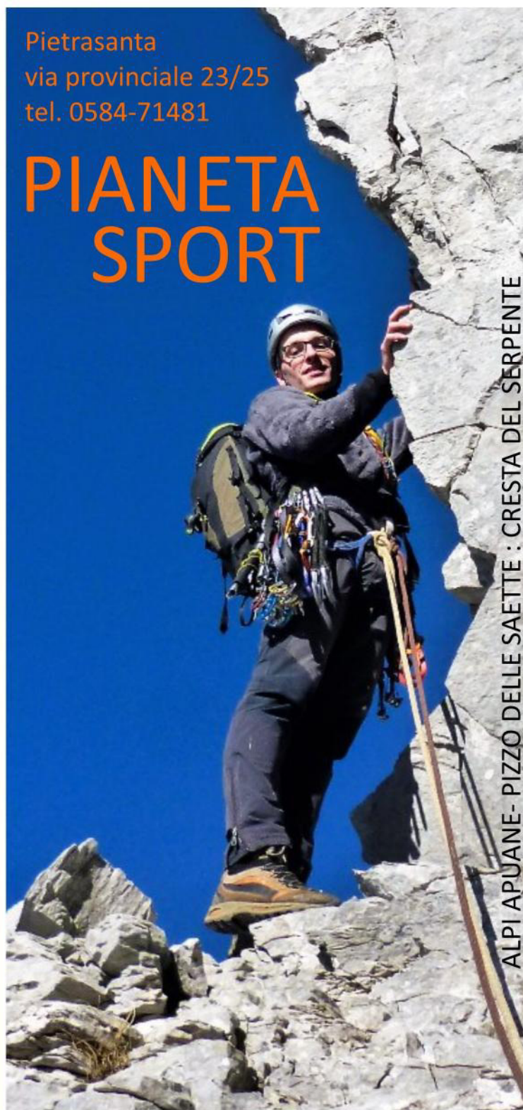
ALPI APUANE- PIZZO DELLE SAETTE : CRESTA DEL SERPENTE